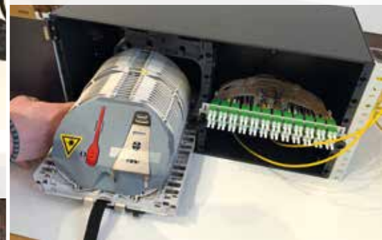
R&M Plattformen: ODF-SCM Optical Distribution Frame, Spleiß und Patch-Bereich sind getrennt, bis zu 144 Fasern möglich, sehr platzsparend. („Die nächste Generation der Netzwerkinfrastruktur.“)